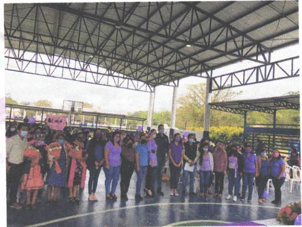
Evento conmemorativo "8M" día internacional de la mujer