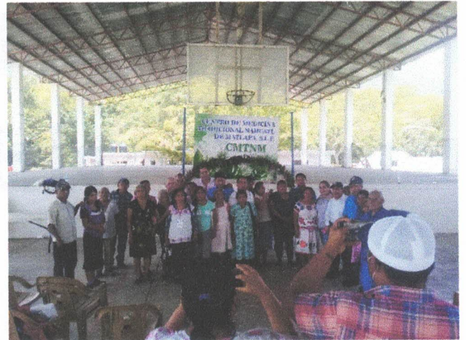
Ofrenda de semillas