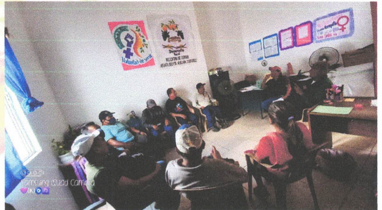
Reunión con los productores de cítricos y litche